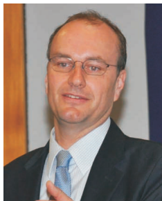
Hermann Hutter Carl Abt GmbH & Co. KG, Ulm