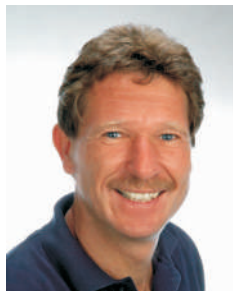
Andreas Raether HobbyFOTO Andreas Raether GmbH & Co., Ludwigsburg