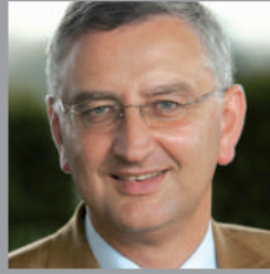
Dr. Nils Schmid MdL Stellvertretender Ministerpräsident und Minister für Finanzen und Wirtschaft des Landes Baden-Württemberg

Die baden-württembergische Wirtschaft hat sich 2010 rasch erholt. Das Vorkrisenniveau hat sie in diesem Jahr übertroffen. Zwar scheint sich das Wachstumstempo nun zu verlangsamen, der Funke auf die Binnenwirtschaft ist aber übergesprungen. Eine äußerst niedrige Arbeitslosigkeit und die Zuversicht der Arbeitnehmer, was die weitere Wirtschaftsentwicklung angeht, haben den Konsum gestärkt.